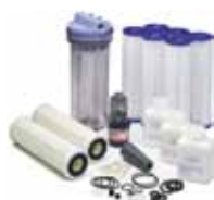
Kit préfiltre & entretien