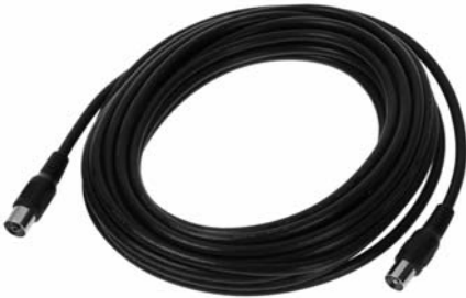
N32 Verlängerungskabel für Echolot-/ Loggeber (6,5m)

Für Ihr neues Nasa Marine Target2 Instrument bieten wir als Zubehör an.