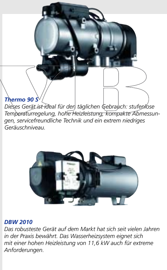
Thermo 90 S Dieses Gerät ist ideal für den täglichen Gebrauch: stufenlose Temperaturregelung, hohe Heizleistung, kompakte Abmessungen, servicefreundliche Technik und ein extrem niedriges Geräuschniveau.