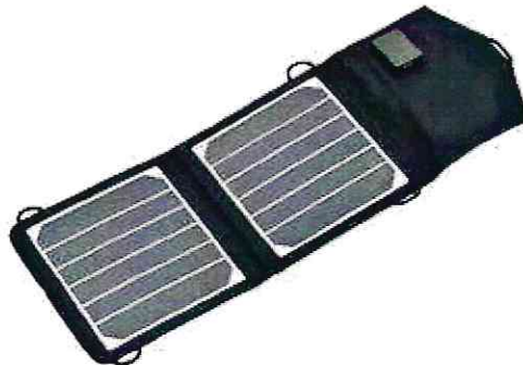
Trek King 2x3,5