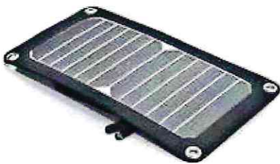
Trek King 1x7

Die technischen Daten finden Sie auf der nächsten Seite.