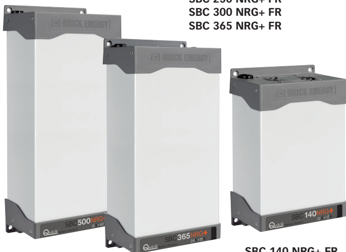
SBC 140 NRG+ FR